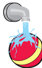
Wash children's toys and babies' pacifiers regularly