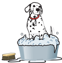
Wash dogs regularly