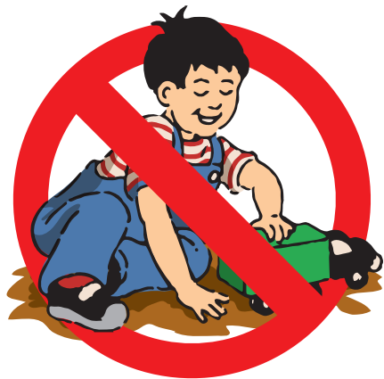
Do not let children play in bare dirt