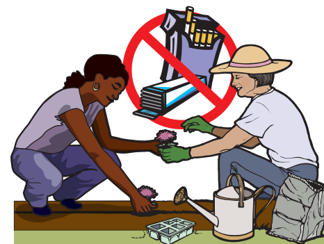
Don't eat food, chew gum, or smoke when working in the yard and wear gloves