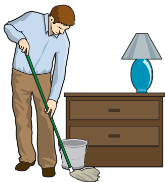
Damp mop floors and damp dust counters and furniture regularly