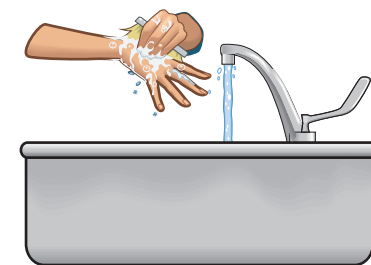
Wash children's hands and feet after they have been playing outside