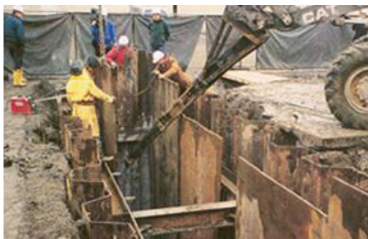
Construcción de una PRB en Sunnyvale, CA.

Las PRB han sido seleccionadas para su uso en docenas de sitios Superfund y otros proyectos de descontaminación en todo el país.