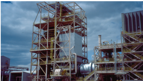
Ejemplo de un incinerador externo.

La incineración puede destruir una amplia gama de desechos muy contaminados y reducir considerablemente la cantidad de material que deba eliminarse en un vertedero. Para zonas pequeñas contaminadas, la excavación y el transporte a un incinerador externo puede ser un método de limpieza rápida. Una limpieza más rápida puede ser importante cuando se debe limpiar un sitio con rapidez para impedir un riesgo inmediato a las personas o el entorno. Aunque los incineradores requieren una gran cantidad de combustible para su funcionamiento, el calor generado a veces se puede utilizar para generar energía eléctrica en un proceso de “valorización energética de residuos.” La incineración dentro o fuera del sitio ha sido seleccionada para su uso en más de 100 sitios Superfund y otros proyectos de descontaminación en todo el país.