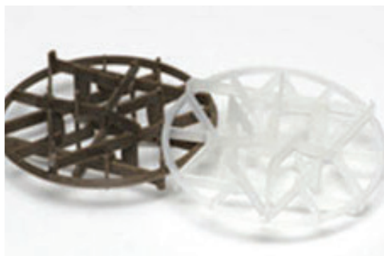
Ejemplo de material de relleno plástico.

La separación por aire es una manera efectiva de eliminar los COV del agua contaminada, y se suele emplear como parte de los sistemas de bombeo y tratamiento de aguas subterráneas en sitios de todo el país. Los separadores por aire se pueden transportar al sitio, lo cual elimina la necesidad de transportar el agua contaminada para que se la trate fuera del sitio. La separación por aire ha sido seleccionada para su uso en cientos de sitios Superfund y otros proyectos de descontaminación en todo el país.