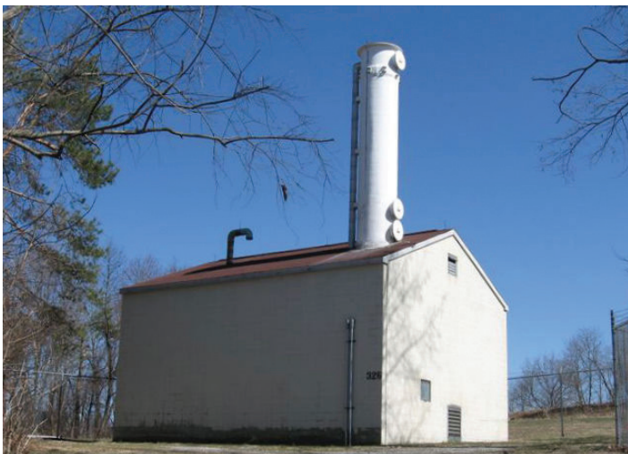
Separador de aire y edificio de tratamiento.

En general, la separación por aire se considera segura. El agua contaminada se contiene a lo largo de todo el proceso de descontaminación, de manera de que hay pocas posibilidades de que la gente entre en contacto con ella. Si es necesario, los vapores químicos producidos por la separación por aire se tratan para garantizar que no se liberen vapores en niveles nocivos.