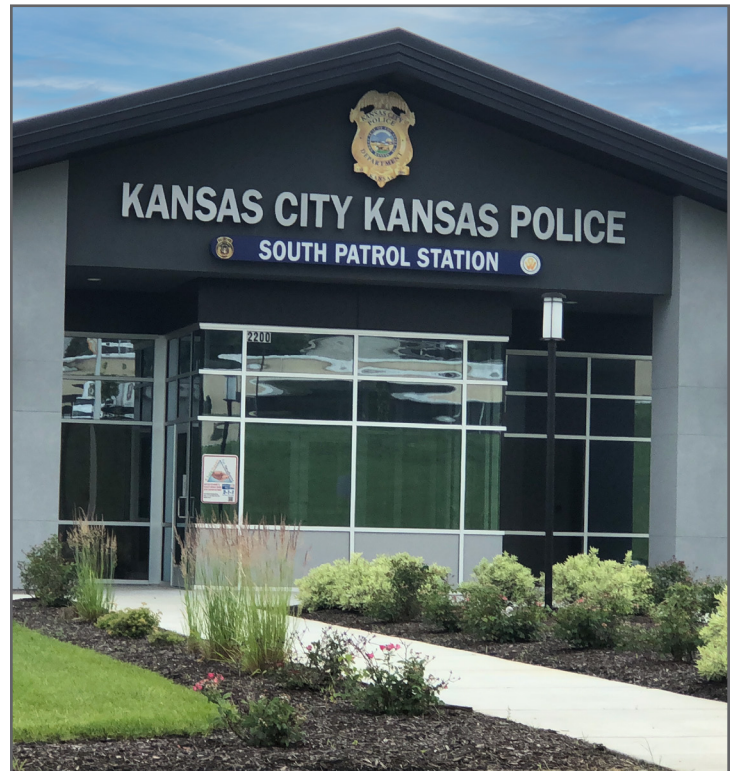
Comisaría de policía en el sitio Superfund de Kansas City Structural Steel en Kansas City, Kansas.

Las protecciones de responsabilidad del Programa Superfund pueden estar disponibles para los gobiernos estatales y locales cuando adquieren una propiedad contaminada a través de la ejecución fiscal, el abandono, la confiscación, el dominio eminente y las transferencias entre unidades de los gobiernos estatales y locales, como bancos de tierras o autoridades de redesarrollo. La EPA recomienda que los gobiernos locales se comuniquen con el personal de la Agencia, consulten con la agencia ambiental estatal correspondiente y su propio asesor legal, y revisen el guía de la EPA sobre las protecciones de responsabilidad del Superfund para los gobiernos locales antes de tomar cualquier medida para adquirir la propiedad o el control o para limpiar o reconstruir propiedad contaminada en un sitio Superfund.