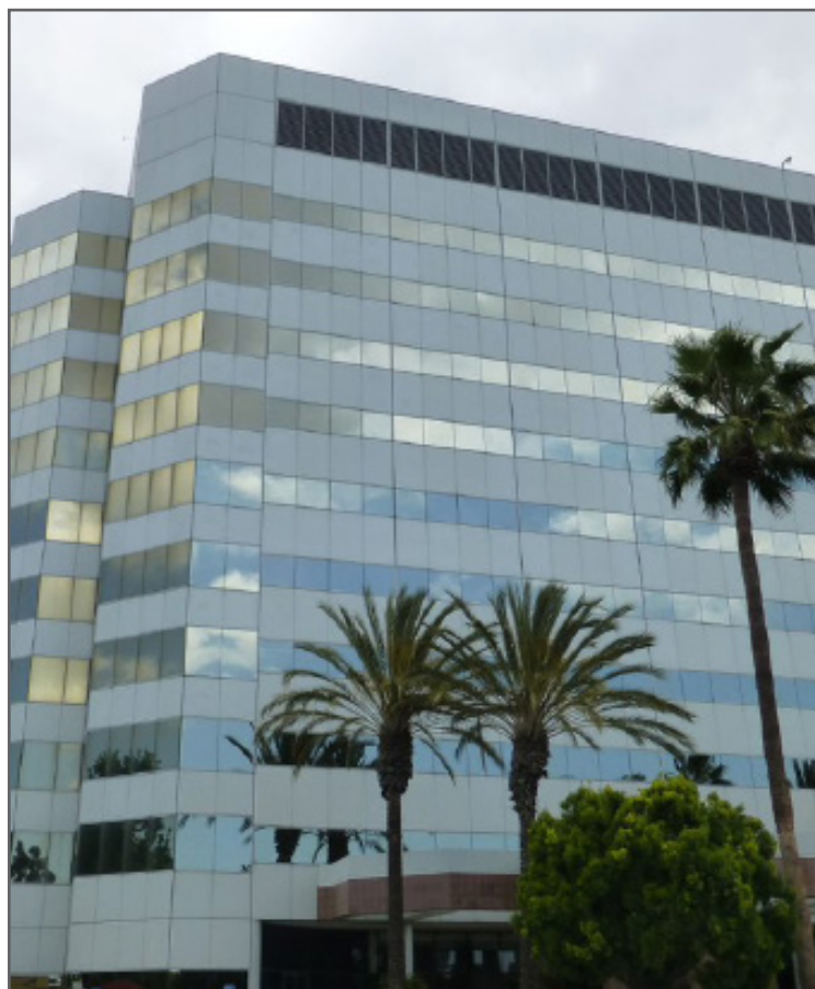
Edificio de oficinas en el sitio Superfund de Del Amo en Los Ángeles, California.

El personal de la EPA también puede discutir herramientas específicas al sitio, cuando corresponda, para facilitar la limpieza, la reutilización y el redesarrollo de las propiedades en los sitios Superfund. Las herramientas