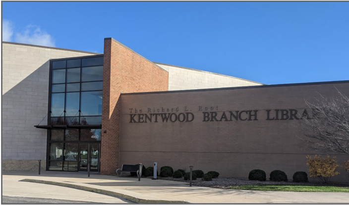
Biblioteca en el sitio Superfund de Kentwood Landfill en Kentwood, Michigan.