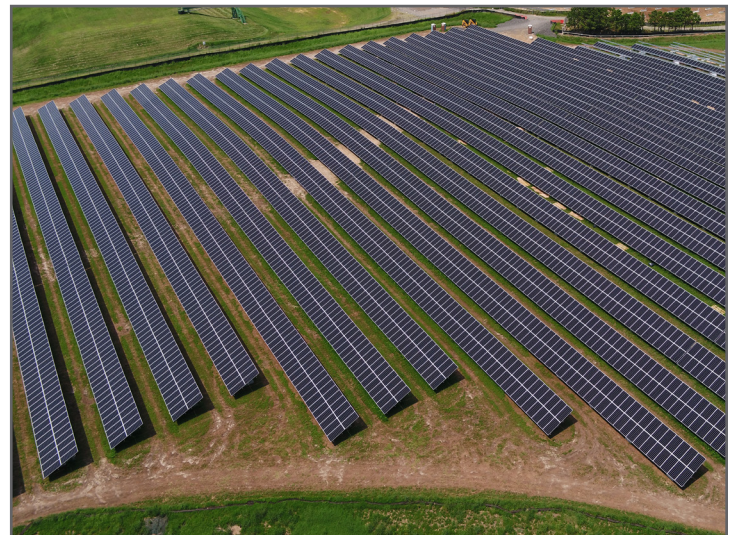
Una matriz solar en el sitio Superfund de Ciba-Geigy Corp. En Toms River, New Jersey.

Puede ser que un comprador o arrendatario quiere asumir el papel de realizar todo o parte del trabajo de limpieza en lugar de esperar a que el grupo potencialmente responsable o el gobierno lo completen. Esto puede permitir que un comprador o arrendatario coordine las actividades de limpieza con sus planes de reutilización y comience el redesarrollo cuanto antes. Por ejemplo, una limpieza realizada por un comprador o arrendatario puede abordar la excavación de suelo contaminado, la instalación de cercas de seguridad, la estabilización de bermas y embalses, o la instalación de sistemas de