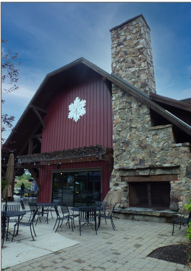
Restaurante en el sitio Superfund de Bunker Hill Mining & Metallurgical Complex en Smelterville, Idaho.

Antes de adquirir una propiedad en un sitio Superfund, la EPA recomienda encarecidamente a un comprador prospecto o arrendatario que consulte con su propio abogado y profesionales ambientales, así como comunicarse con el personal de la EPA, el gobierno estatal, tribal o local correspondiente y el propietario actual de la propiedad. Estos contactos pueden ayudar a los grupos interesados a comprender el estado del sitio y determinar si existen restricciones planificadas o existentes sobre el uso del terreno que puedan afectar los planes de reutilización de la propiedad.