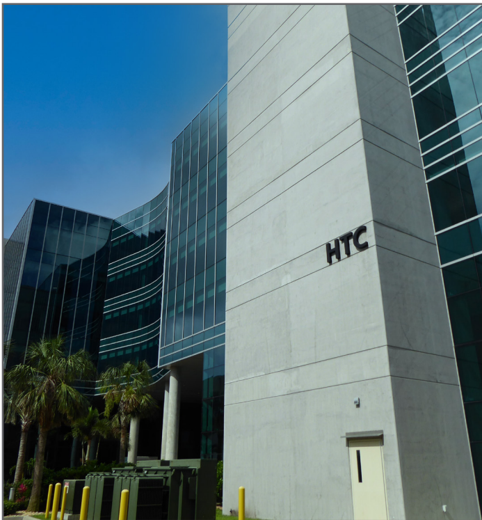
Harris Technology Center en el sitio Superfund de Harris Corp. (Palm Bay Plant) en Palm Bay, Florida.