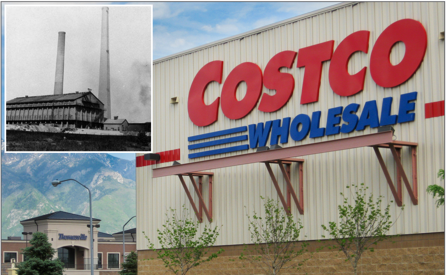
Antes y Después: Desarrollo comercial en el sitio Superfund de Murray Smelter en Murray City, Utah.

El personal de la EPA puede estar disponible para reunirse en persona, por teléfono o electrónicamente para discutir las condiciones del sitio, los plazos de limpieza y compra, y los asuntos de los compradores prospectos. La Agencia también recomienda encarecidamente a los compradores prospectos y otros grupos interesados que se comuniquen con el gobierno estatal, tribal o local apropiado para analizar posibles problemas de limpieza y responsabilidad que puedan surgir bajo sus autoridades legales independientes. El personal de la EPA puede proporcionar a las partes información de contacto del gobierno estatal, tribal o local.