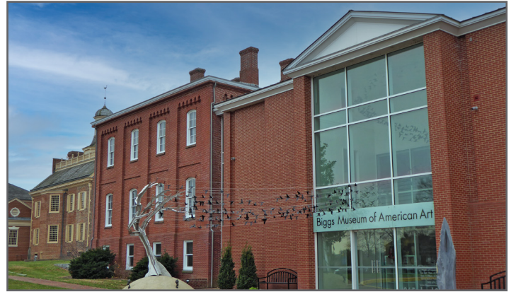
Museo en el sitio Superfund de Dover Gas Light Co. en Dover, Delaware.

Descargo de responsabilidad: Este documento se proporciona al público únicamente para resaltar y resumir ciertos aspectos de un programa más completo. El documento no brinda asesoramiento legal, no tiene ningún efecto legalmente vinculante ni limita ni amplía las obligaciones en virtud de ninguna ley federal, estatal, tribal o local. Este documento no tiene la intención y no crea ningún derecho sustantivo o procesal para ninguna persona en equidad o ley. Es responsabilidad exclusiva del comprador mantener sus protecciones de responsabilidad y asegurarse de que el uso propuesto no interfiera con la limpieza del sitio. Los compradores prospectos deben consultar con su propio asesor legal para determinar las responsabilidades potenciales de CERCLA y la aplicabilidad de la defensa BFPP en su situación específica.