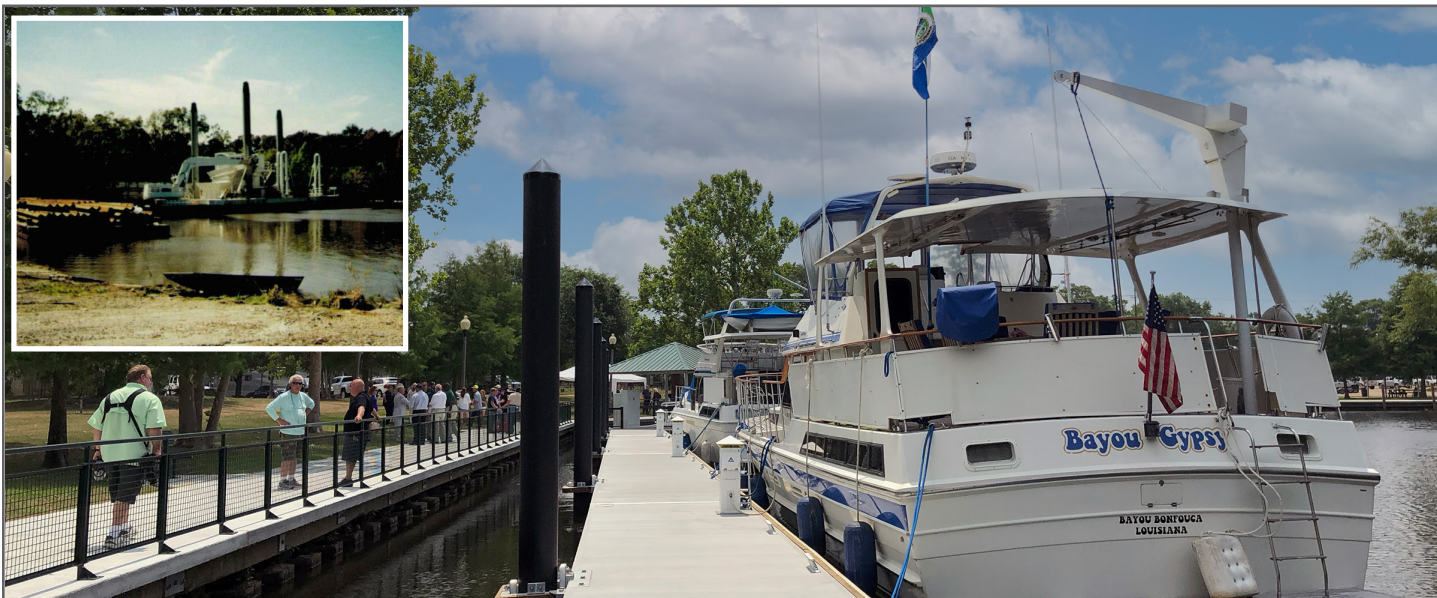
Antes y después: Marina en el sitio Superfund de Bayou Bonfouca en Slidell, Louisiana.

contención, incluidas tapas y cubiertas de vertederos. Los compradores y arrendatarios deben proteger la limpieza y evitar la propagación de la contaminación para mantener las protecciones de responsabilidad del Programa Superfund. La EPA por lo general apoya el trabajo de limpieza por parte de compradores y arrendatarios. Dicho trabajo puede acelerar una limpieza, permitir que la propiedad logre el uso del terreno futuro razonablemente anticipado, facilitar la administración a largo plazo de la propiedad, conservar los recursos federales y apoyar los objetivos de la comunidad. El trabajo de limpieza propuesto por un comprador o arrendatario requiere la supervisión de la EPA y se considera a base del sitio específico para su aprobación.