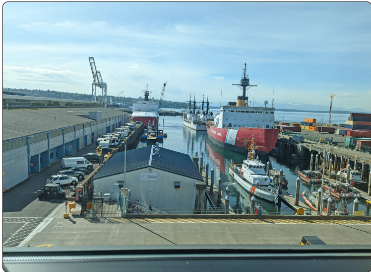
រូបភាព 2. រូបភាពនៃ Slip 36