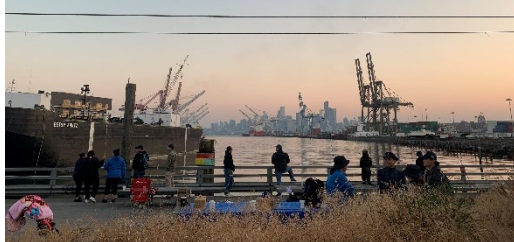
Figure 2 - Spokane Street Bridge Fishing Competition

El Sitio Superfund de Harbor Island se encuentra en las áreas ancestrales de la tribu Muckleshoot (reconocida por el gobierno federal), la tribu Suquamish (reconocida por el gobierno federal), las tribus y bandas confederadas de la nación Yakama (reconocidas por el gobierno federal) y la tribu Duwamish. Harbor Island alberga el Spokane Street Bridge, un muelle de pesca muy popular, lo que significa que los pescadores se ven afectados por este sitio. Las empresas y las industrias que operan en Harbor Island y sus alrededores también se ven afectadas por la limpieza de Harbor Island. Los vecindarios residenciales cercanos de Georgetown y South Park