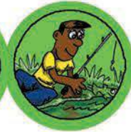
PESCAR Y LIBERAR PECES