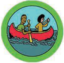
NAVEGAR EN CANOA