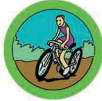
ANDAR EN BICICLETA